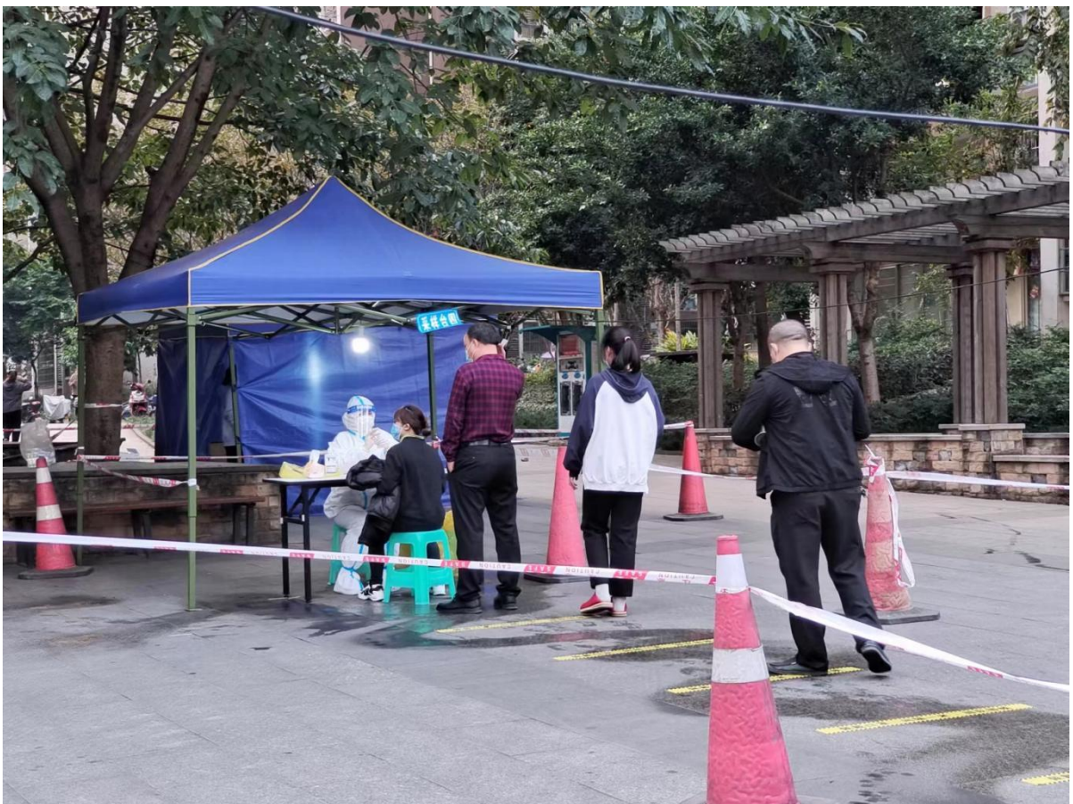
社区扩面核酸检测现场