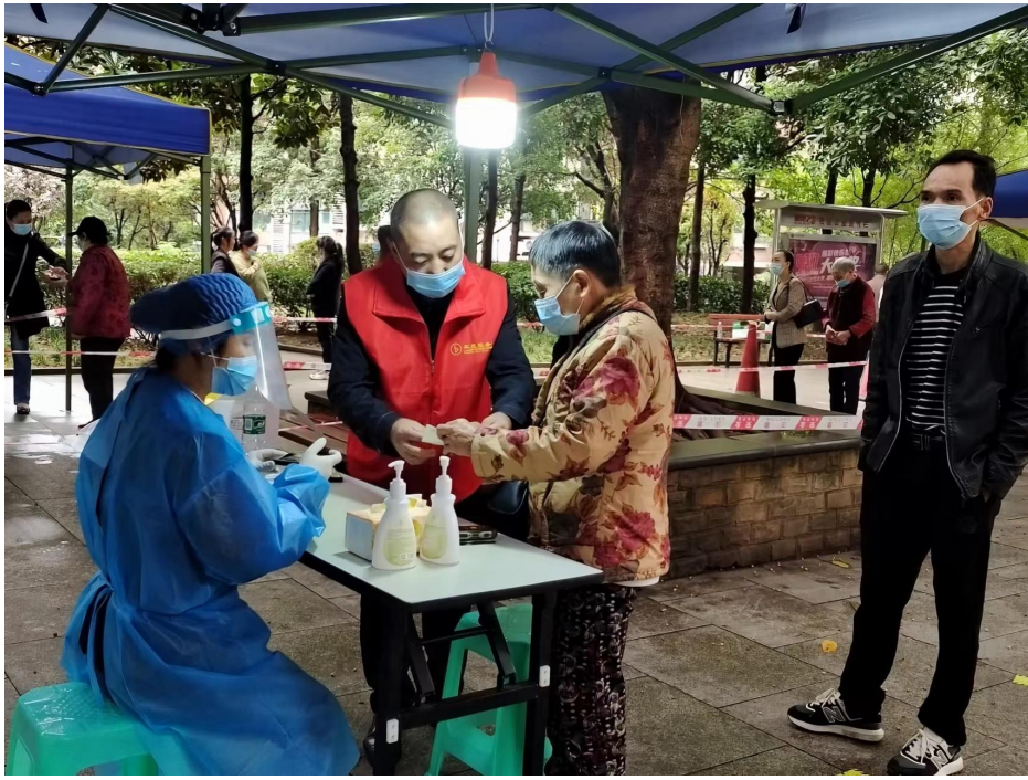
协助老人做核酸信息采集