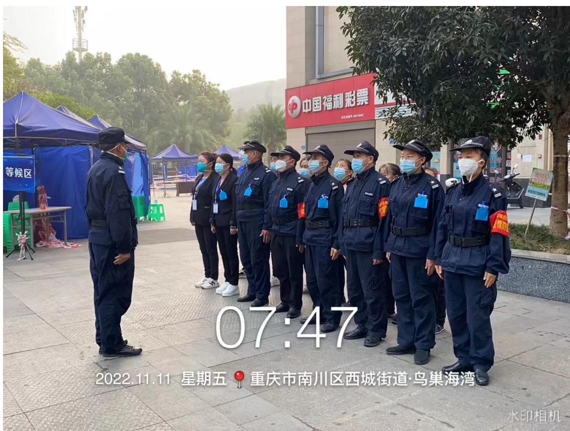
佩戴粉剂蓝贴，提高防护能力