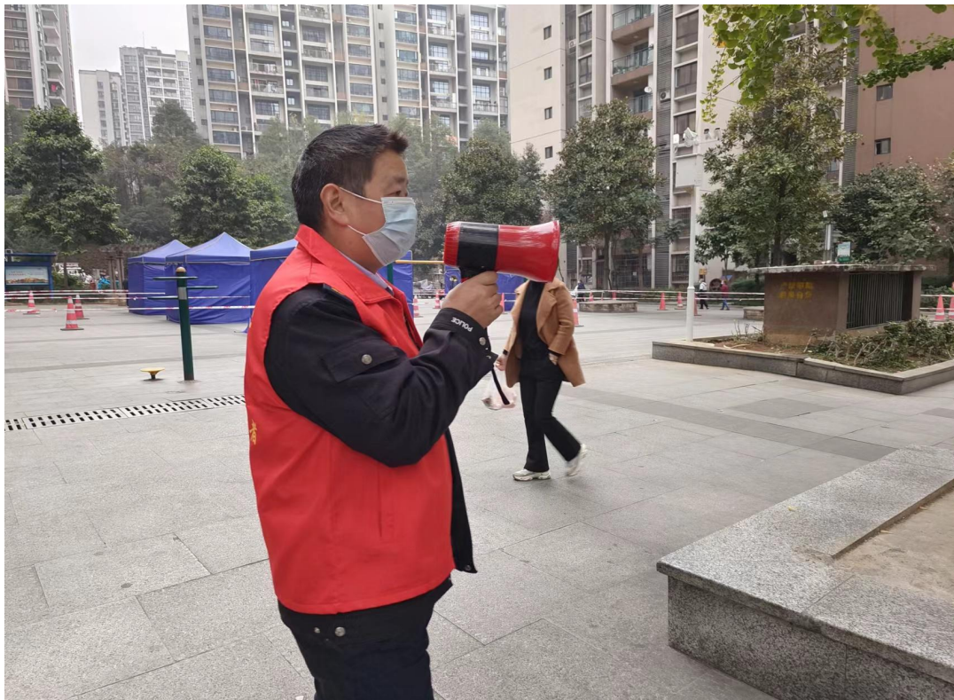
行走的小喇叭：呼吁业主不聚集、不扎堆、戴好口罩

四、获得业主认可，为物业点赞。 持续三年的疫情抗战，让广大业主真正认识了经常出现在他们的视野却从未走入他们内心的物业人，也看到了他们不顾自身安危勇往直前的大无畏精神。业主们纷纷为三度物业点赞，赠送锦旗和物资进行慰问。