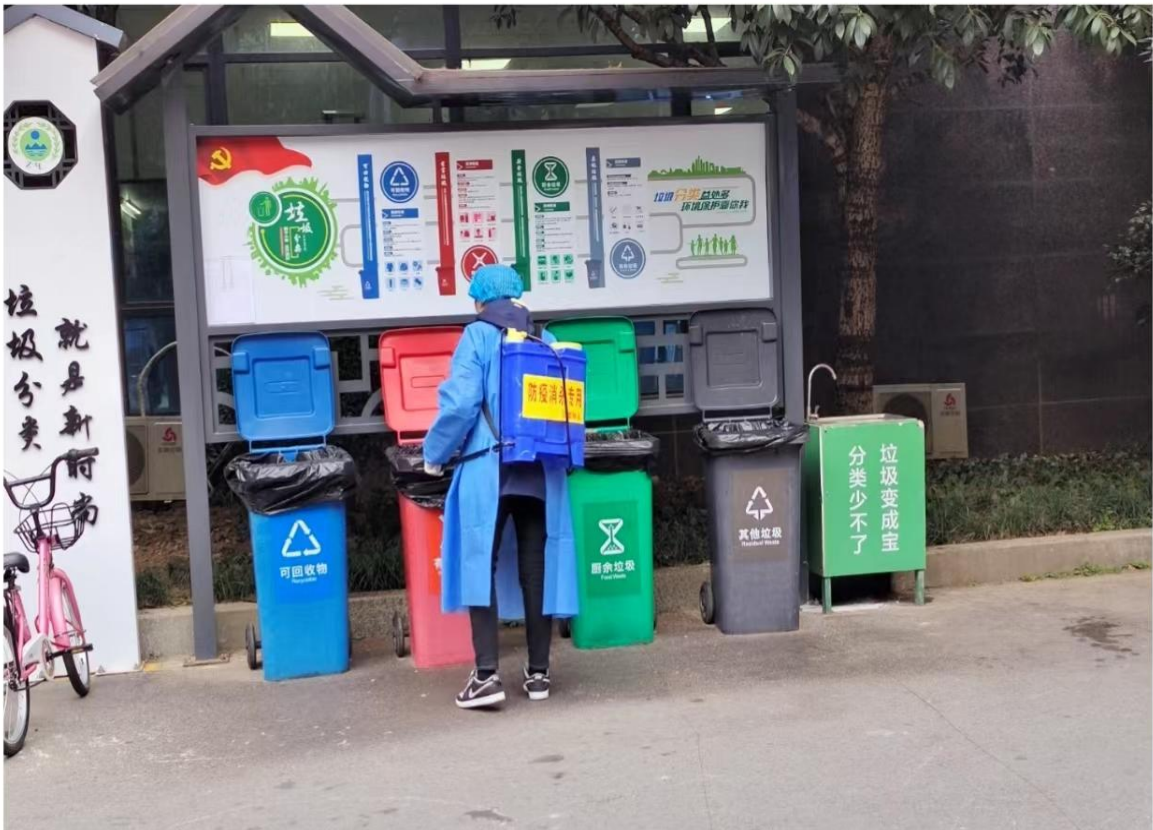
每日做好防疫消杀工作