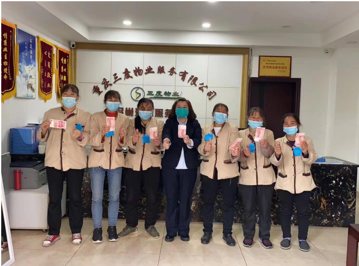
为一线员工发放抗疫补贴