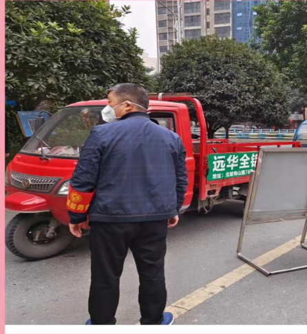
志愿者引导进入小区人员、车辆亮码、扫码、登记