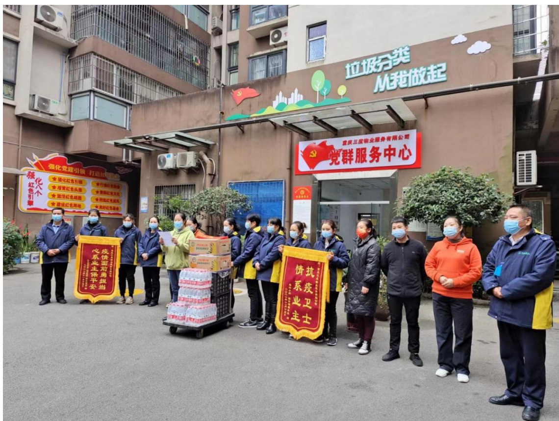
业主的认可，是我们最大的动力