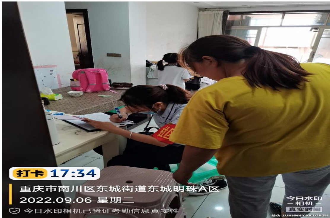
▲ 重庆励尚物业管理有限公司-东城明珠A区小区