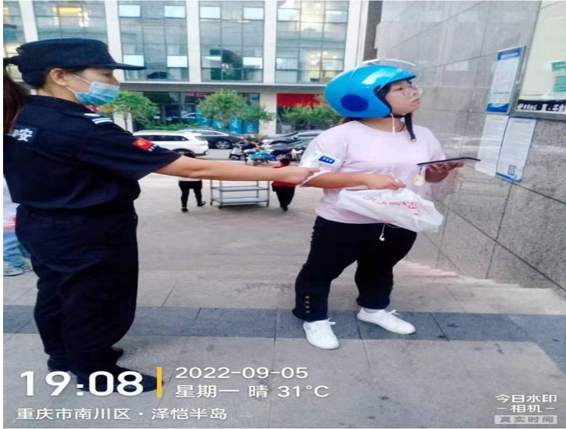
▲ 重庆市南川区元凯物业管理有限责任公司-泽恺半岛小区