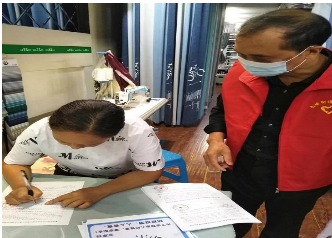
▲重庆重庆薪贸物业管理有限公司南川分公司