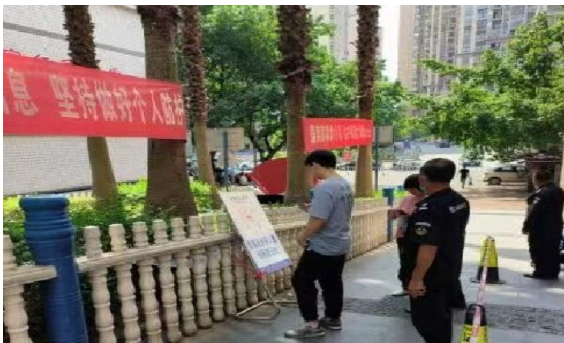
▲ 重庆世恒物业管理有限公司南川分公司-金山丽苑小区