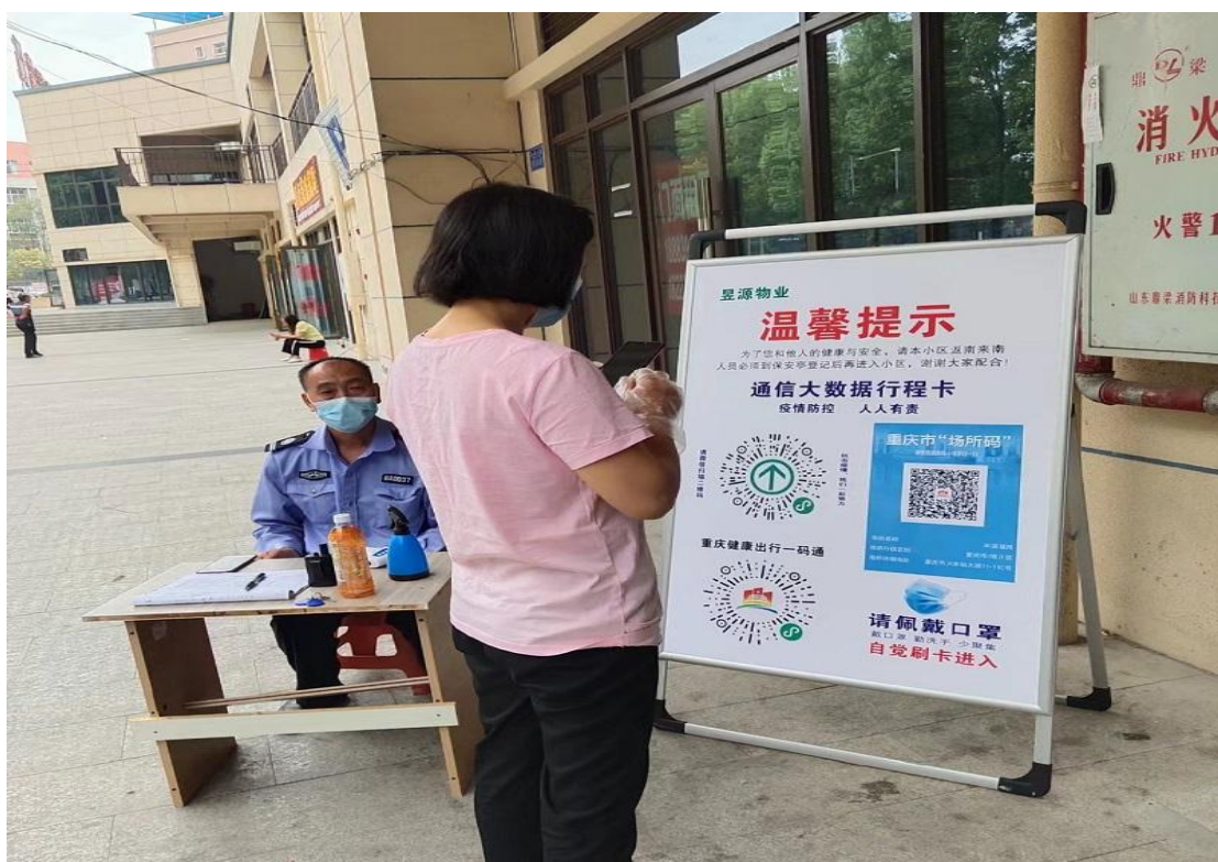
▲重庆昱源物业管理有限责任公司