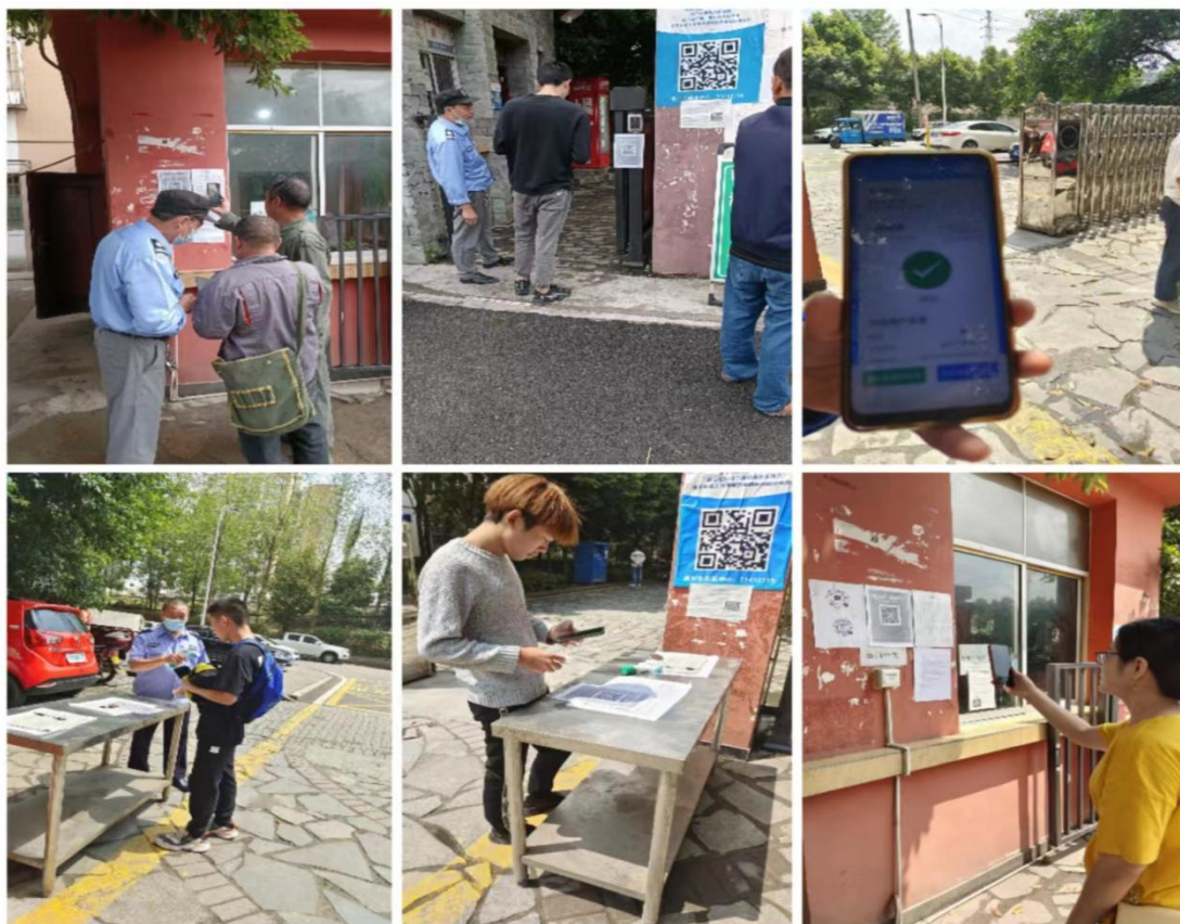
▲ 重庆敏洪物业管理有限公司