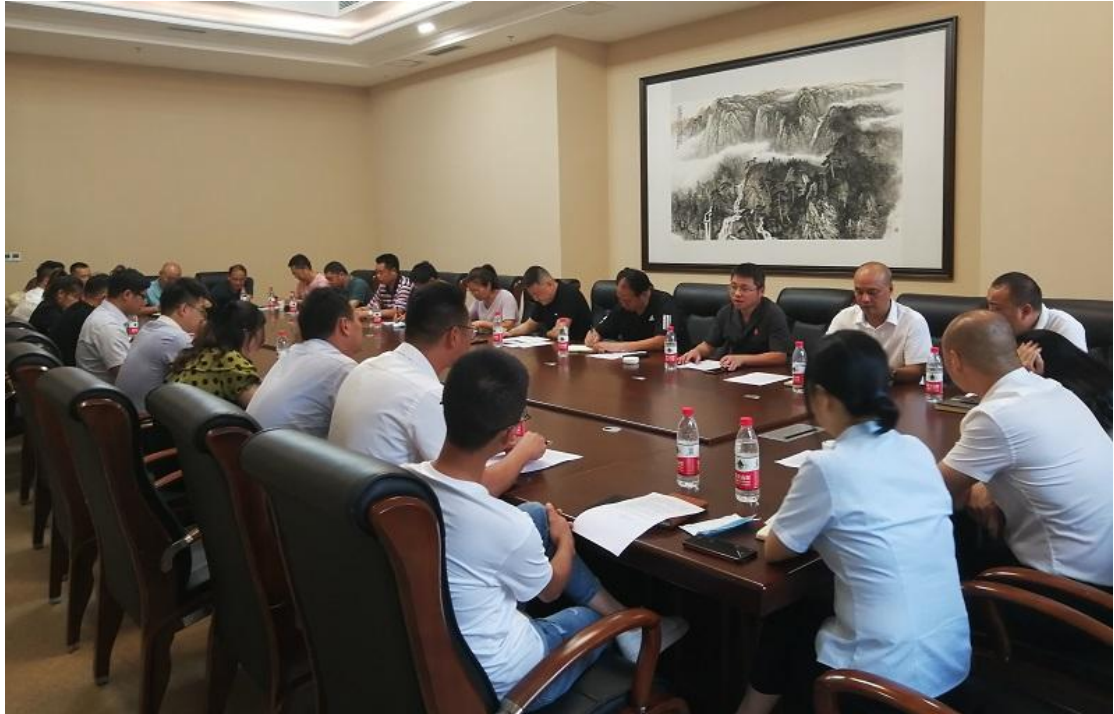
三季度理事会、监事会会场

参加单位：区住房和城乡建设委、区人民法院、东城街道办事处、南城街道办事处、西城街道办事处相关领导，物业协会会长、副会长、理事单位负责人，监事会全体监事共 28 人参加。