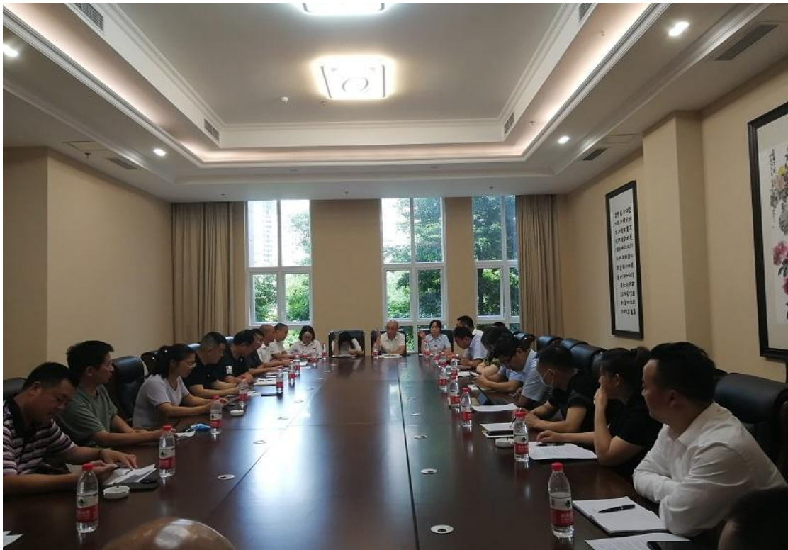
监事会全体成员审议表决理事研讨的各项事宜并一致通过

(六)、监事会全体成员对理事会研讨事项进行审议，是否通过会议的事项进行审议并举手表决。