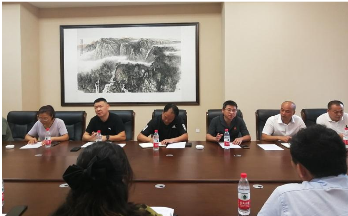
杨宝黎庭长对物业诉讼工作、服务质量考评工作进行指导

(七)、区人民法院杨宝黎庭长对如何进一步开展好物业小区服务质量考评进行指导，并对各物业企业在案件诉讼工作存在的一些问题进行解答提出改进方法。