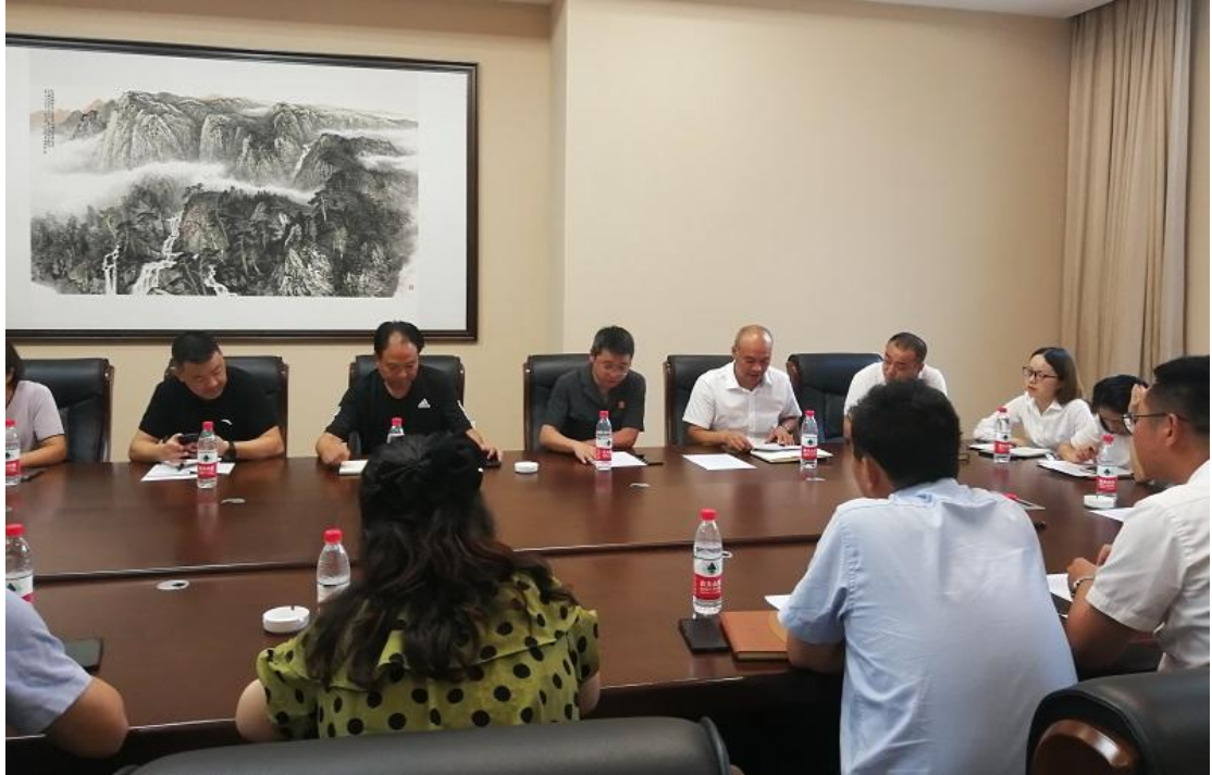
陈会长通报相关工作事项并对当前物业工作进行安排

(六)、监事会全体成员对理事会研讨事项进行审议，是否通过会议的事项进行审议并举手表决。